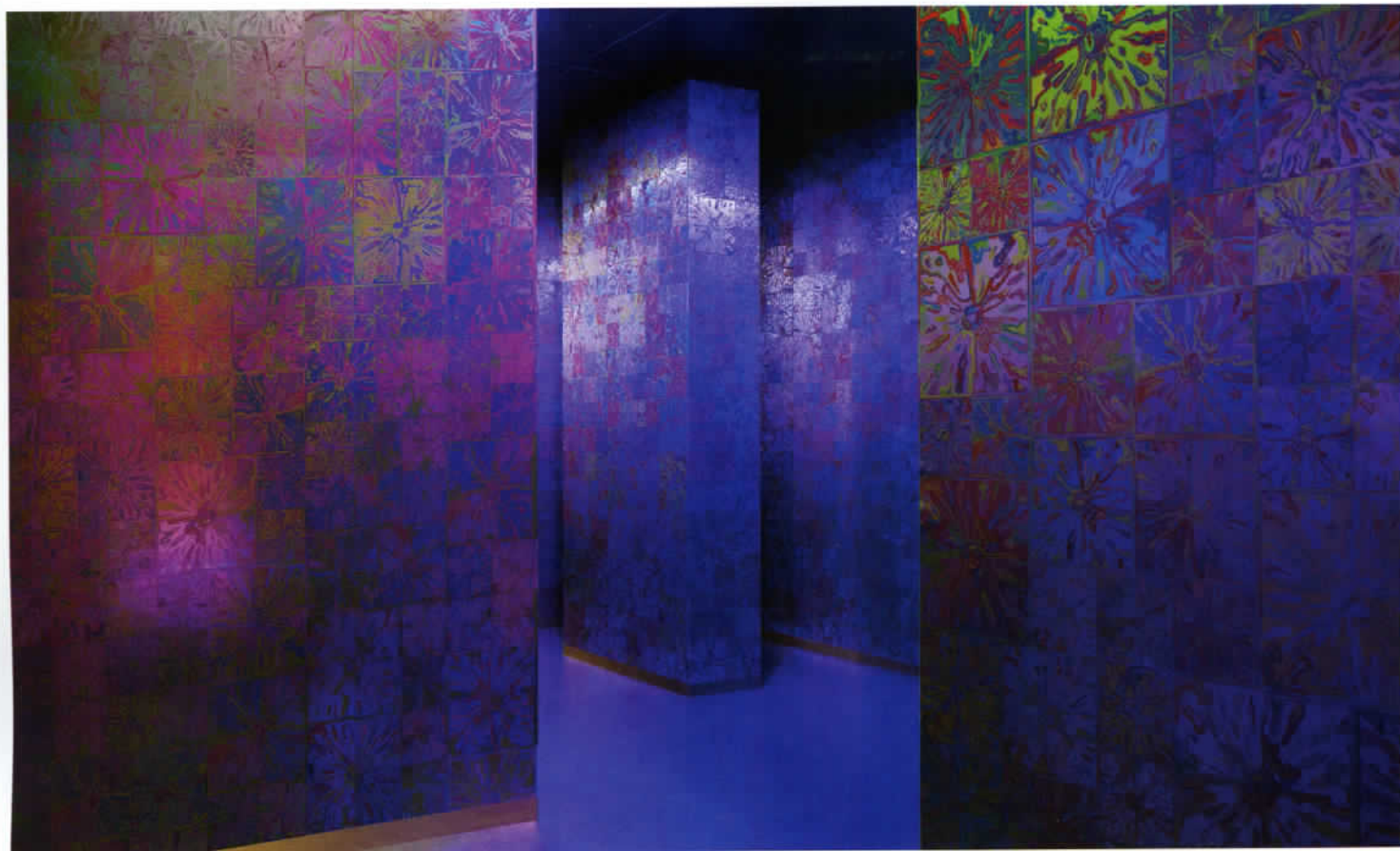
Heterotopia I. 2019. Magazzini del Sale, Venise. (Commissariat de curated by Gea Politi et and Flash Art; avec des œuvres de with works by Lauren Clay, Andrew Kuo et and RM Fischer)