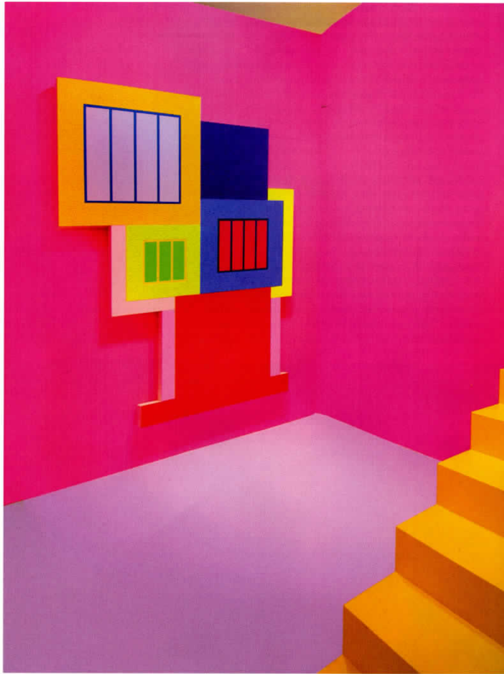
Heterotopia II. 2019. Greene Naftali, New York

Heterotopia I fut suivi de Heterotopia II, à la galerie Greene Naftali, à New York (6). Vous avez construit toute une architecture dans le vaste espace de la galerie. Il y avait des escaliers, des espaces à différents niveaux, autour d'un noyau jaune vif. Le visiteur avait l'opportunité de faire l'expérience de vos peintures de l'intérieur. J'ai été complètement fascinée par le fait que, dans cette installation, vous remettiez en cause la distinction entre images bidimensionnelles et objets tridimensionnels, que vous rendiez ambivalents, voire paradoxaux – transitifs, comme deux faces de la même médaille. Pour cette exposition, je voulais voir les caractéristiques de la peinture et de l'architecture s'effondrer et se confondre. L'architecture était configurée de manière à encadrer les tableaux; mais, en même temps, les peintures agissaient comme des représentations de l'architecture. J'ai composé les peintures comme des vues en coupe, mais il aurait aussi bien pu s'agir de plans de niveau. Les peintures partageaient ensuite la matérialité de l'architecture, de plusieurs manières. La configuration ou la composition de la surface des peintures n'était pas seulement un diagramme plat, elle comportait aussi des surfaces en bas-relief dans le même genre de matériaux que la finition des murs qui les entouraient (stuc, placoplâtre, etc.). En même temps, la palette des peintures se trouvait aussi transférée sur les murs, les poutres, le sol et les marches d'es-